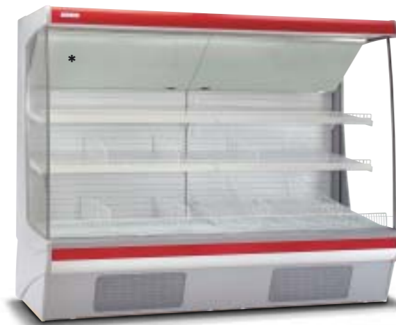
Disponibile versione 3M1. Version 3M1 (meat) available.